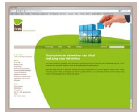
De vernieuwde I.V.M. website: www.ivmmilieubeheer.be .

We danken het bureau Nelson uit Leuven voor het fijne wordingsproces van deze vernieuwde uiting van onze identiteit.